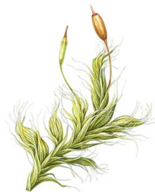
Den avbildade mossan är raggmossa Racomitrium lanuginosum (ill. Pollyanna von Knorring).

www.artdatabanken.se www.naturskola.se www.miljoskolan.se www.bioresurs.uu.se